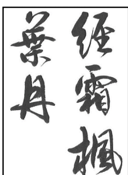
高校・一般 (書体は自由)