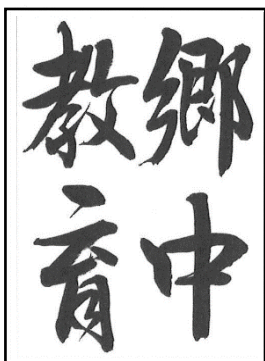
中学2・3年生 (楷書または行書)