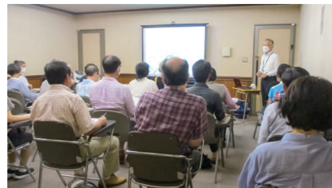
▲ 前回の歴史講座の様子