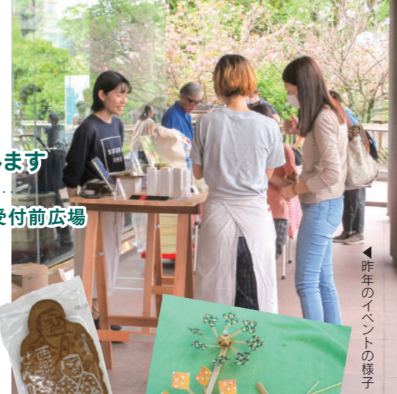
◀ 昨年のイベントの様子

12:20からは管楽五重奏による「おでかけランチタイムコンサート」も開催。日置市よしとし軍議場による薩摩武士体験、竹で作る風車や竹とんぼのワークショップもあります。歴史・文化薫る甲突川河畔で、ゆったりほっこり過ごしませんか?