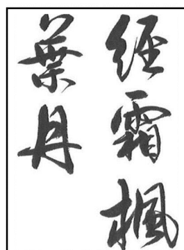
高校・一般 (書体は自由)