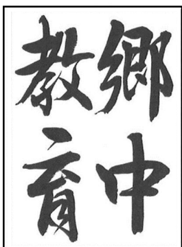
中学2・3年生 (楷書または行書)