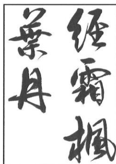
高校・一般 (書体は自由)