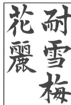
高校・一般 (書体は自由)