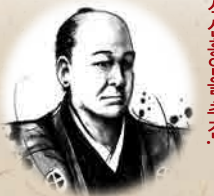
시마즈 나리아키라 근대적 세계관, 부국강병, 식산흥업을 추진.

1827년 시타카지야초에서 출생. 에도시대 말기에서 유신기에 활약. 삿초 동맹과 보신 전쟁 등에 진력을 다하고 새 정부 수립에 공헌. 1877년 51세 때 세이난 전쟁에서 패하고 시로아마에서 사망.