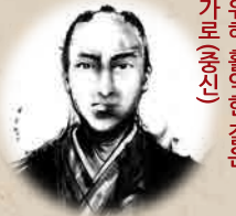
고마쓰 다테와키 메이지 유신 실현을 위해 활약한 절영(가로(유신))

1830년, 고라이초에서 출생하였고, 에도시대 말기부터 졸군 중앙 정계에서 활약. 세이난 전쟁 때 사이고와 결별. 군주국가 실현을 위해 노력. 1878년, 49세 때 암살됨.