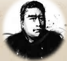
사이고 다카모리 도량이 넓고 정이 많은 대인의 방장

1827년 시타카지야초에서 출생. 에도시대 말기에서 유신기에 활약. 삿초 동맹과 보신 전쟁 등에 진력을 다하고 새 정부 수립에 공헌. 1877년 51세 때 세이난 전쟁에서 패하고 시로아마에서 사망.