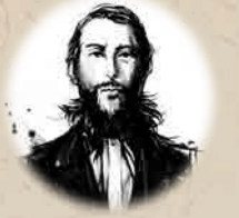
오쿠보 도시미치 냉정하고 넓은 시야, 사를 버리고 공에 진력

시마즈가문 28대 당주(사쓰마번 11대 번주). 1809년 에도에서 출생. 번의 부국강병과 식산흥업을 위해 '슈세이칸 사업'을 추진. 1858년 50세를 일기로 급사.