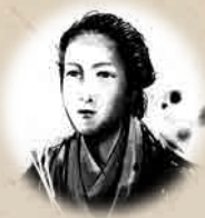
사이고의 아내 변혁기의 리더

1835년 이마이즈미 시마즈가에서 출생. 22세 때 도쿠가와와 혼인. 2년만에 남편 이에사다가 병사. 사쓰마번이 막부 토벌의 선두로 나선 상황에서 도쿠가와 가문의 존속을 위해 진력.