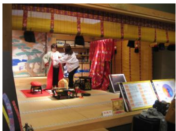
篤姫居室 記念撮影風景