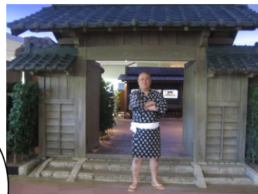
西郷そっくりさん